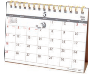
M095-32 M/M ムーミン リング卓上カレンダー