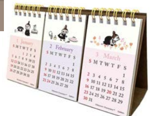
EM100-03 M/M ムーミン リトルマイ3か月卓上カレンダー