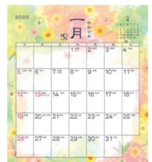
AM130-94 四季色暦カレンダー