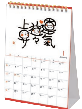
M095-36 笑い文字 卓上カレンダー