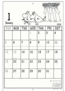
AM160-09 M/M ムーミン 大判カレンダー