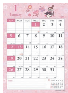
AM150-36 M/M ムーミン リトルマイ見やすいカレンダー