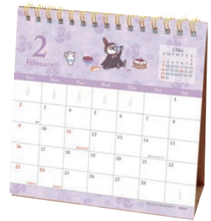
M085-29 M/M ムーミン リトルマイ卓上カレンダー