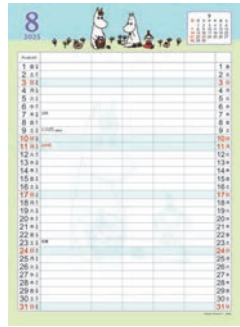
M140-96 M/M ムーミン ファミリーカレンダー