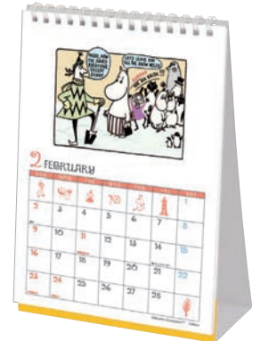
M095-33 M/M ムーミン 原画卓上カレンダー