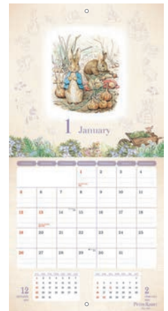
AM150-33 PTR ピーターラビット™ カレンダー