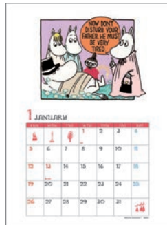
DM120-13 M/M ムーミン 原画カレンダー