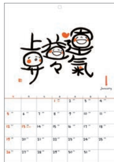
AM140-02 笑い文字 カレンダー