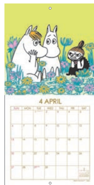
DM120-12 M/M ムーミン スクエアカレンダー